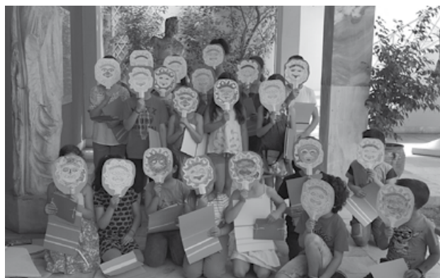
Θερινό εκπαιδευτικό πρόγραμμα για παιδιά σχολικής ηλικίας.

γκεκριμένου μήνα ως μήνα ευαισθητοποίησης για «την τέχνη πέρα από την όραση» (Art beyond Sight). Το 2014 επιλέχθηκε το θέμα «Αρχαία ελληνικά μουσικά όργανα στο Εθνικό Αρχαιολογικό Μουσείο». Περιελάμβανε συζήτηση, όπου οι συμμετέχοντες είχαν τη δυνατότητα να αγγίξουν ακριβή αντίγραφα αρχαίων ελληνικών μουσικών οργάνων (λύρα, τύμπανο, σείστρο, αυλός, μονοκάλαμος σύριγξ, ρόπτρον και κύμβαλα), πήλινων αγγείων με σχετικές παραστάσεις και ειδωλίων που κρατούν μουσικά όργανα, και να ακούσουν αρχαία ελληνική μουσική από τον μουσικοσυνθέτη Νίκο Ξανθούλη με τη βοήθεια αρχαίας ανακατασκευασμένης λύρας.