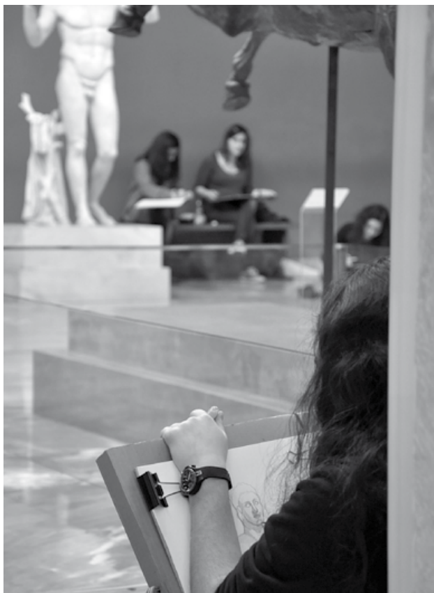
Σύγχρονη καλλιτεχνική αναμέτρηση στις αίθουσες του Μουσείου.

Από το 2005 έως σήμερα, το Εθνικό Αρχαιολογικό Μουσείο παρέχει δωρεάν εκπαιδευτικά προγράμματα και δράσεις που απευθύνονται σε σχολικές ομάδες αλλά και σε ειδικές κατηγορίες κοινού, όπως σε μαθητές νοσοκομείων, καταστημάτων κρά-