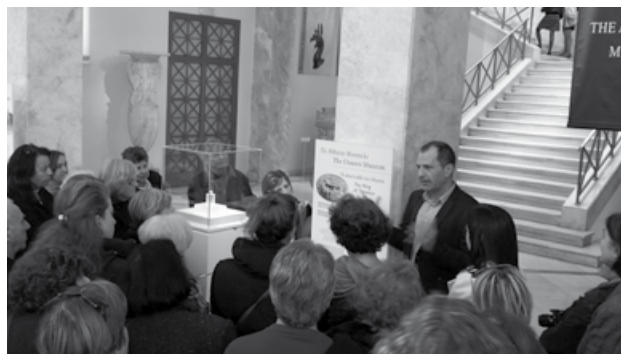
«Το Δαχτυλίδι του Θησέα»: Παρουσίαση του πρώτου εκθέματος του «Αθέατου Μουσείου».