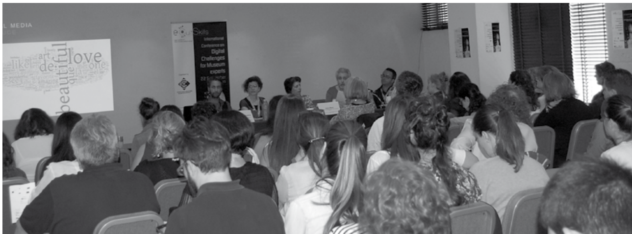
Στιγμιότυπο από την 3η συνεδρία.

of the eCult Skills Project), παρουσιάστηκαν στο κοινό τα σημαντικά αποτελέσματα του έργου από τους εταίρους και τους ειδικούς που συμμετείχαν σε αυτό. Κατά τη δεύτερη συνεδρία, με τίτλο «Τα μουσεία στην ψηφιακή εποχή» (Museums in the Digital Era), σημαντικοί εκπρόσωποι διαφορετικών μουσείων από την Ελλάδα και το εξωτερικό παρουσίασαν τη δική τους οπτική για τη στάση των μουσείων απέναντι στις πρόσφατες ψηφιακές αλλαγές και απαιτήσεις. Η τρίτη συνεδρία είχε τίτλο «Δεξιότητες, νέες προκλήσεις και τάσεις. Οι επαγγελματίες των μουσείων και οι ειδικοί ΤΠΕ απαντούν» (Skills, New Challenges and Trends. Museum Professionals and ICT Experts Respond). Κατά τη διάρκεια της εκδήλωσης εκπρόσωποι φορέων πολιτισμού και ειδικοί από τον χώρο της αγοράς και της έρευνας «συνομίλησαν» με πανεπιστημιακούς για τις εξελίξεις στις νέες τεχνολογίες αλλά και για την απαιτούμενη «ψηφιακή εγγραμματοσύνη» (digital literacy) του