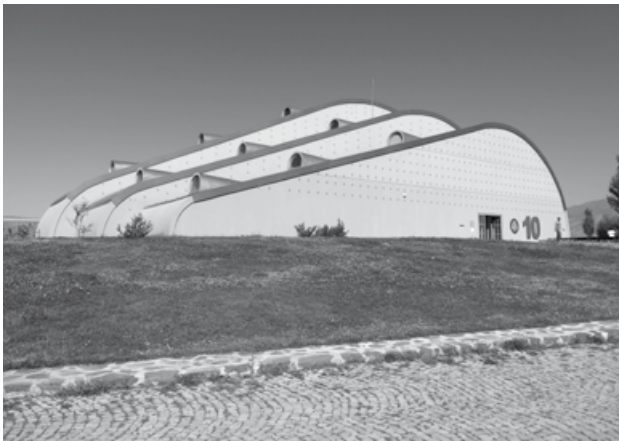
Το κεντρικό κτήριο του Μουσείου. Ο αριθμός 10 είναι ο τίτλος της έκθεσης που φιλοξενείται το διάστημα αυτό στο Μουσείο, σε επιμέλεια του Γερμανού επιμελητή τέχνης Marcus Graf, για να τονίσει τα δέκα χρόνια λειτουργίας του Baksı.

Το μεγαλύτερο όμως παράδειγμα των δυνατοτήτων που έχουν και προσφέρουν τα μουσεία έδωσε το ίδιο το Baksı που φιλοξένησε τη συνάντηση. Το Μουσείο Baksı ( http://en.baksi.org ) –ονομάστηκε έτσι από το αρχικό όνομα του χωριού δίπλα στο οποίο κτίστηκε– ιδρύθηκε τον Ιανουάριο του 2005 από τον Prof. Dr. Hüsamettin Koçan, καλλιτέχνη και πανεπιστημιακό. Καταγόμενος ο ίδιος από το ομώνυμο χωριό, από την εξαιρετικά απομακρυσμένη από τα μεγάλα αστικά κέντρα και ιδιαίτερος φτωχή περιοχή της Bayburt, στην ανατολική Τουρκία (3-4 περίπου ώρες με αυτοκίνητο νοτιοανατολικά από την Τραπεζούντα), θέλησε